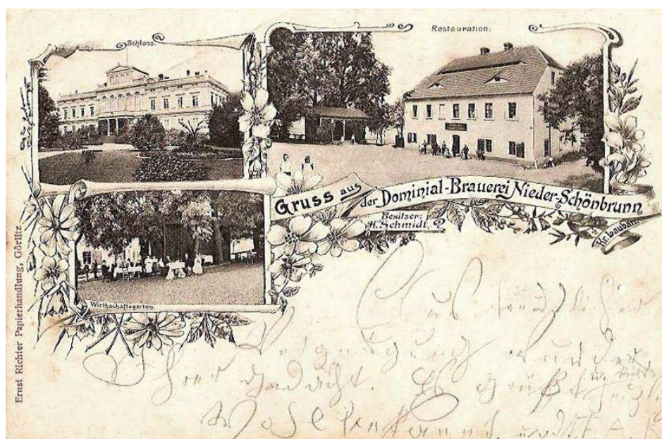
Rys. 3 Przedwojenna pocztówka.

Z zespołu pałacowego zachowały się: mur, brama wjazdowa z XVIII wieku z kamiennym kartuszem wjazdowym i kwiatonem, oficyna z przełomu XVIII i XIX wieku, z portalem i oknami w opaskach a także zabudowania gospodarcze: stajnie i obory z XIX wieku. W parku nieliczne okazy strych drzew: cisów, lip i dębów.