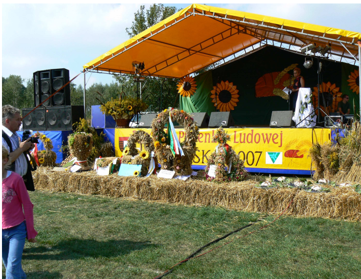
Rys. 5 Dożynki Gminne.

Mieszkańcy organizują coroczne imprezy „Przeгляд Piosenki Ludowej”, biorą udział w imprezach o zasięgu gminnym, powiatowym, międzynarodowym. Ochotnicza Straż Pożarna bierze udział we wszelkich zawodach i należy w nich do faworytów. Mieszkańcy wyremontowali kaplicę na cmentarzu parafialnym własnym staraniem.