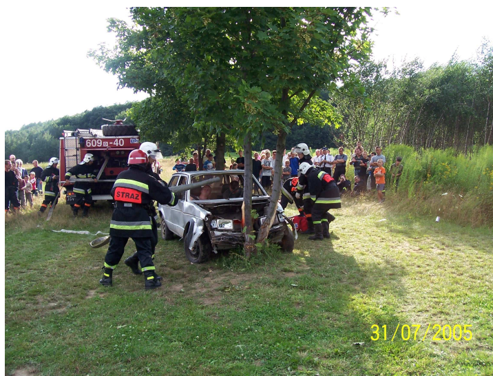
Rys. 6 Zawody Sportowo – pożarnicze.