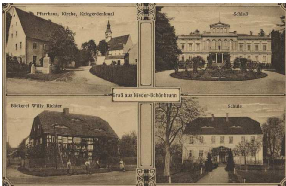
Rys. 2 Przedwojenna pocztówka.