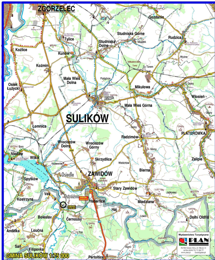
Rys 1 Mapa Gminy Sulików.

Najbardziej urozmaiconą rzeźbę terenu i najwyższe wysokości względne mają Wzgórza Zalipiańskie leżące w południowo-wschodniej części gminy Sulików (m. Miedziana, Bierna, Radzimów Górny). Najwyższym punktem jest szczyt Wyszyny (ponad 400 m n.p.m.). Druga, co do wysokości jest Góra Piekielna – 385 m n.p.m. Wzgórza rozcięte są doliną Czerwonej Wody i jej dopływów.