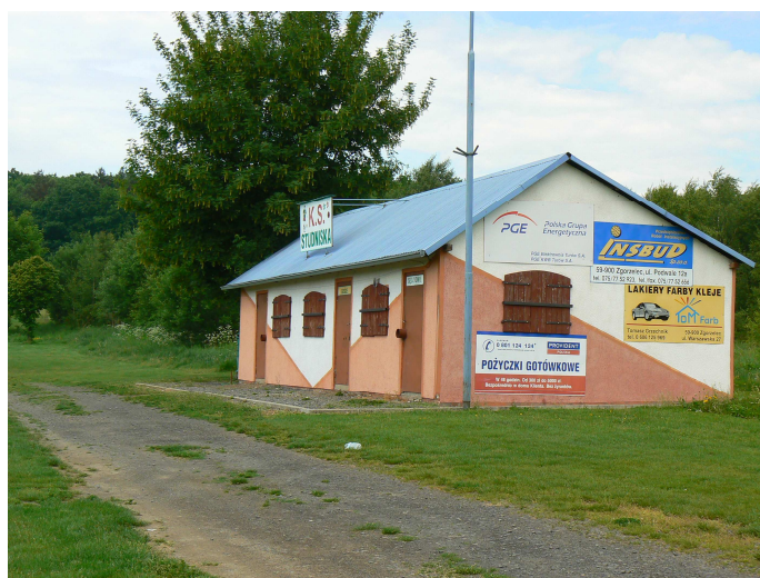
Szatnia sportowa przy boisku