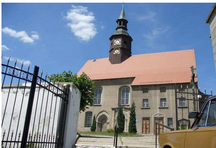
Kościół pw. Św. Anny