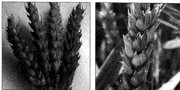
Objawy choroby na kłosach

Data publikacji komunikatu: 03.06.2011 r.