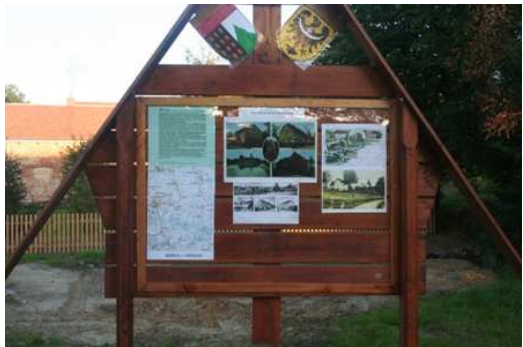
Tablica informacyjna Sołectwa Bierna