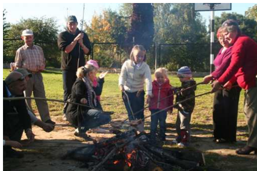
Festyn w Biernej