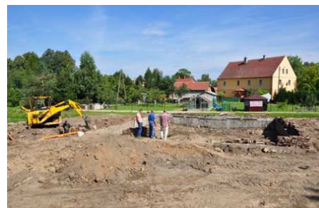
I etap Budowy Centrum rekreacyjnego